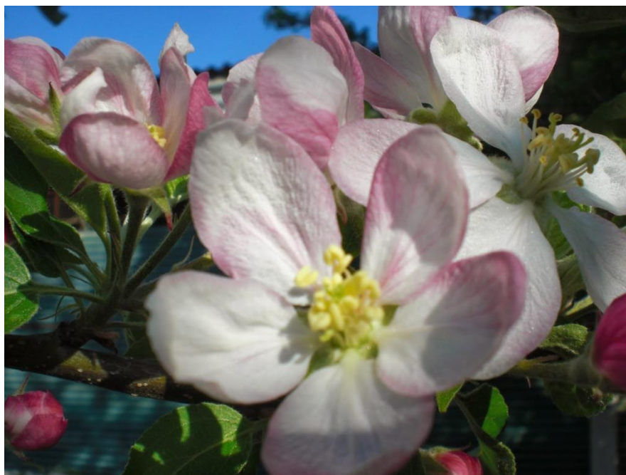
Figura 2. Flor de manzano, la cual dara lugar al fruto.

En el mes de marzo se presenta la llamada generación suicida de la palomilla de la manzana esto es porque se viene una generación sin tener donde desarrollarse (fruta), de manera natural así se presenta por razones de acumulación de horas calor es allí el llamado biofix, se comienza a considerar este punto para iniciar con el control químico de la plaga, incluso es el momento idóneo para comercialmente meter la feromona de disrupción sexual ya que al tener control sobre esta generación se evita al máximo el control de esta mediante esté método químico.