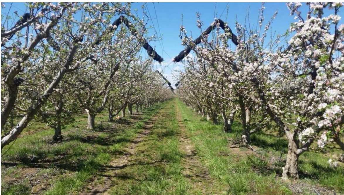
Figura 1. Huerta Manzanera, cd. Cuauhtemoc Chihuahua.

En el mes de Febrero del 2015 no se realizaron acciones por lo que no se reporta a este mes ninguna meta cumplida, el cultivo en el mes de Febrero aún se encuentra en dormancia acumulando horas frío, para poder tener un buen desempeño en la temporada, ya que es un factor decisivo en la adaptación del Manzano. De este requerimiento depende la ruptura de la dormancia. Cuando las especies frutales de clima templado no resultan expuestas a temperaturas bajas de acuerdo a sus necesidades específicas (siendo en general la eficiencia máxima entre 2,5 y 9,1 °C), se observan un conjunto de síntomas entre los que resultan más comunes los siguientes: retraso en la apertura de yemas de madera, retraso en la apertura de yemas de flor, brotación irregular y dispersa y desprendimiento de las yemas de flor. Consecuentemente, la productividad de la especie se ve seriamente comprometida.