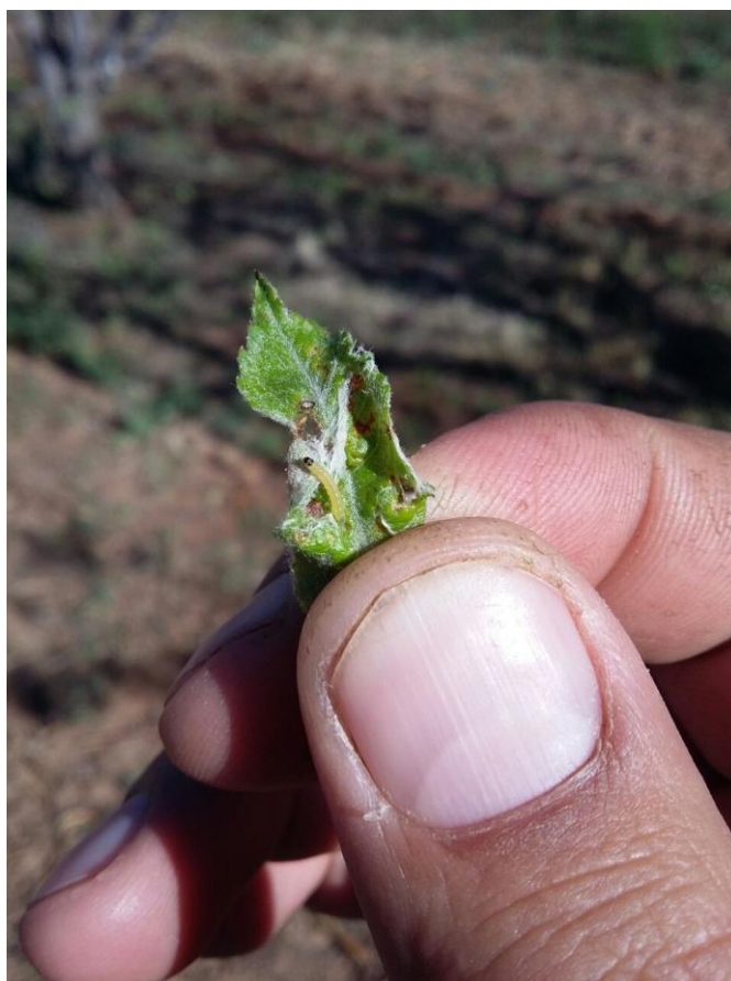
Figura 2. Larva de enrollador de las bandas oblicual Namiuipa, Chihuahua.

Este mes la Palomilla de la manzana ya se encuentra haciendo daños en fruto y el enrollador de las banda oblicuas en hojas y fruto, por lo cual se intensifica la actividad de muestreo, y los técnicos comienza a hacer sus recomendaciones de aplicación, para bajar los índices de incidencia, ya que es daño que a estas fechas logre hacer las dos plagas objetivo, son cruciales para el desarrollo y calidad de la Manzana.